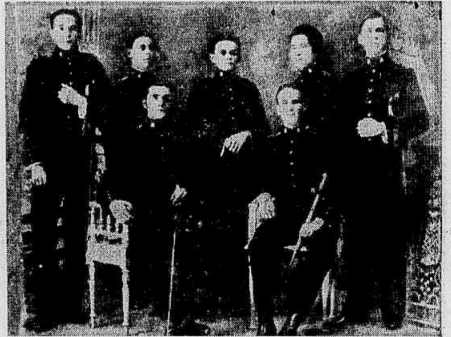
Ao centro da foto, o cadete Castelo Branco